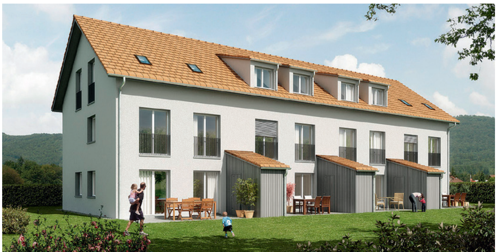
Lebensraum «Lachenmatte», 6153 Ufhusen LU