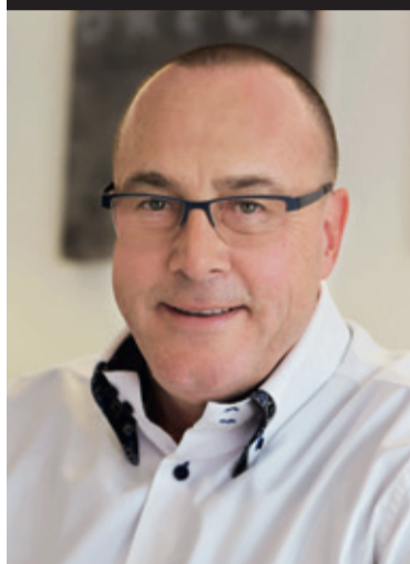
Urs Möckli Zielbau AG

Nach diesem Motto erstellen wir täglich neue Wohnungen und Einfamilienhäuser in der Deutschschweiz. Mit der Erfahrung aus über 4 500 realisierten Wohneinheiten sind wir auch Ihr Garant für Ihr neues Zuhause.